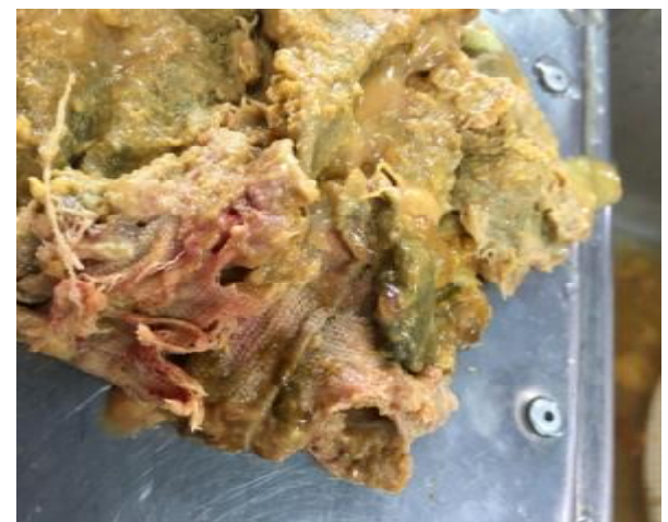
تصویر 3- لنگاز داخل توده