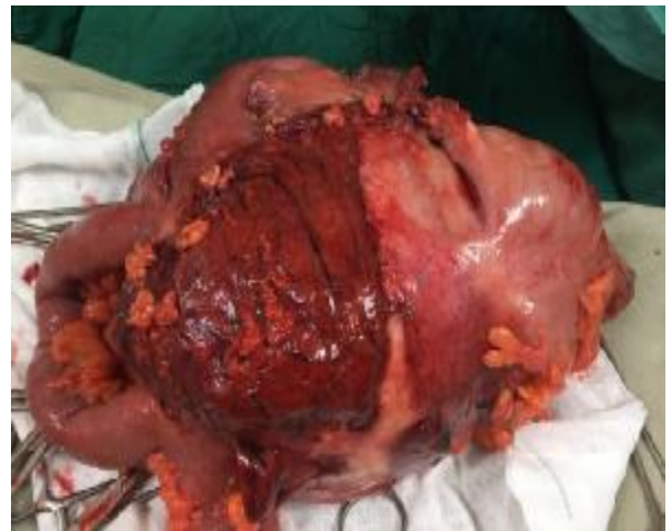
تصویر 2- توده داخل شکم که مجموعه‌ای از ایلئوم و سکوم غیر قابل افتراق است

در بررسی پاتولوژی توده، گاسپیپوما ناشی از باقی ماندن لنگاز از عمل قبلی بدون شواهدی از بدخیمی گزارش شد (تصویر 3).