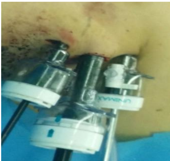
تصویر 2 - تعبیه سه پورت

ابتدا دیسکسیون بین عضله پکتورالیس ماژور و پلاتیسمما صورت گرفت. تروکارهای پلاستیکی لاپاروسکوپیک 10 و 5 در برش‌های انجام شده تعبیه شد (تصویر 2).