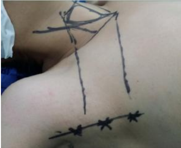
تصویر 1- مارکر گذاری بر روی گردن و زیر بغل

ابتدا دیسکسیون بین عضله پکتورالیس ماژور و پلاتیسمما صورت گرفت. تروکارهای پلاستیکی لاپاروسکوپیک 10 و 5 در برش‌های انجام شده تعبیه شد (تصویر 2).