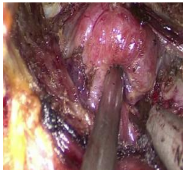
تصویر 4 - لیگاتور پل تحتانی تیروئید

ورید تیروئید میانی و پل تحتانی لوب راست به وسیله Sonicision قطع شدند (تصویر 4). غده پاراتیروئید تحتانی و عصب رکورنت (RLN) شناسایی شده و برای حفاظت از آنها دقت لازم صورت گرفت. قدم بعدی دیسکسیون پل فوقانی لوب راست و لیگاتور عروق تیروئیدی فوقانی بود که با Sonicision انجام شد (تصویر 5).