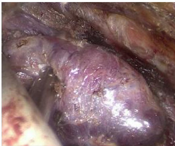
تصویر 5 - لیگاتور پل فوقانی تیروئید

درنهایت با مراقبت از عصب رکورنت و غده پاراتیروئید فوقانی، لیگامان Berry قطع شد. لوب راست و اتصالات ایسم تیروئید به تراشه آزاد شد. آنگاه ایسم از لوب چپ به وسیله Sonicision قطع شد (تصویر 6). نمونه پاتولوژی که شامل لوب راست و ایسم بود با استفاده از کیسه لاپاروسکوپی از محل پورت 10 خارج و یک عدد درن هموواک در محل عمل تعبیه شد. یک روز بعد از عمل بیماران مرخص شدند.