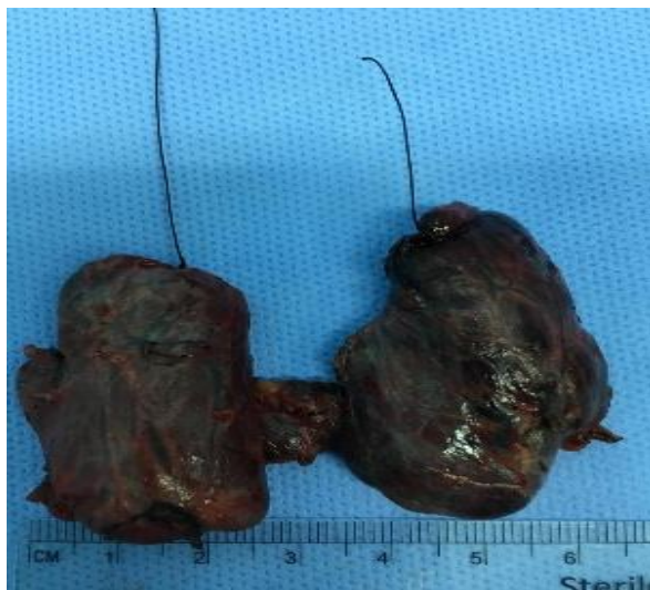
تصویر 1- نمای ماکروسکوپی از تیروئید بیمار که کاملاً سیاه رنگ است

جواب پاتولوژی منطبق بر سرطان پاپیلری به همراه درگیری غدد لنفاوی بود (تصاویر 2 و 3) و بیمار جهت ید درمانی ارجاع گردید.