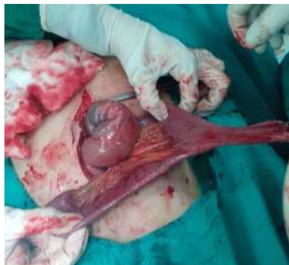
تصویر ۳- نمای دیورتیکول مکل بزرگ متصل به جدار شکم