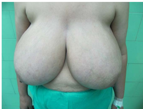
تصویر ۱ - بیماری با شکایت پستان‌های حجیم

تقارن پستان دو طرف (خوب، متوسط و بد)، حس نیپل - آرئول (خوب، متوسط و بد)، درخواست عمل جراحی مجدد، فاصله استرنال ناچ تا نیپل (سانتیمتر)، رضایت کلی بیمار (خوب، متوسط و بد)، بروز سایر عوارض، از دست رفتن نیپل - آرئول و فراوانی افتادگی پل تحتانی پستان پس از عمل بین دو گروه مورد بررسی و مقایسه قرار می‌گرفتند. جمع‌آوری داده‌های بالینی و تمام جراحی‌ها به سرپرستی یک جراح (نویسنده اول) و با تکنیک واحد انجام گرفت. به منظور مقایسه داده‌های کمی بین دو گروه از آزمون تی برای نمونه‌های مستقل و برای مقایسه داده‌های کیفی از آزمون کای اسکوار یا آزمون دقیق فیشر به تناسب استفاده شد. تمامی آنالیزها با نرم افزار SPSS ۱۷ صورت گرفت. مقدار عدد P کمتر از 0.05 معنی‌دار در نظر گرفته شد (جدول ۱، تصاویر ۱ و ۲).