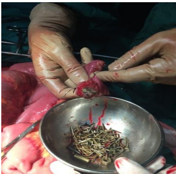
تصویر ۳- انترتومی و خارج سازی اجسام خارجی از روده

سپس دئودنوم کوخرایز شده و اجسام خارجی با انگشت و با احتیاط به ژژنوم هدایت شد و انترتومی روده باریک در محل های ژژنوم و دیستال ایلئوم انجام و تعدادی اجسام خارجی نیز از آنجا خارج شد (تصویر ۳).