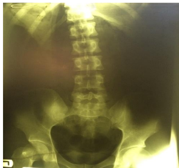
تصویر ۴- گرافی پورتابل پس از عمل بیمار

پس از اطمینان از عدم وجود جسم خارجی در معده و روده باریک اجسام باقی مانده از طریق وارد کردن مقادیر فراوانی نرمال سالین به داخل کولون از برش ایلئوم و دوشیدن به سمت رکتوم هدایت شد و سپس تعدادی زیادی نیز از راه رکتوم و در وضعیت لیتوتومی خارج گردید. در مجموع ۲۱۶ عدد جسم خارجی شمارش شد و پس از اتمام عمل، عدم وجود جسم خارجی با گرافی پورتابل شکم تأیید گردید (تصویر ۴). برای بیمار روز پنجم بعد از عمل، تغذیه شروع شد و با حال عمومی خوب به بخش روانپزشکی منتقل گردید.