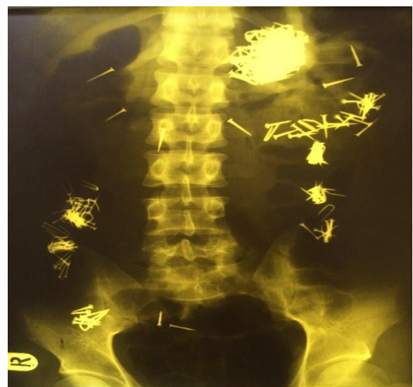
تصویر ۱- تعداد فراوانی میخ بلعیده شده مشهود است