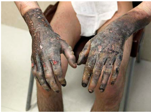
تصویر ۲ الف