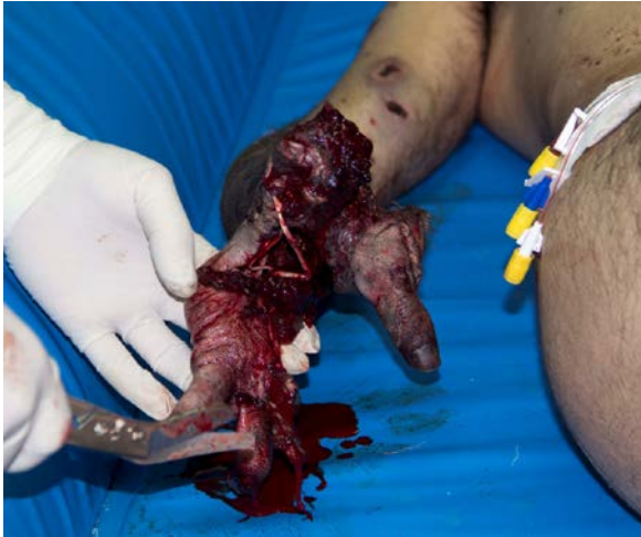
تصویر ۱ - دست آسیب دیده در اثر ترقه