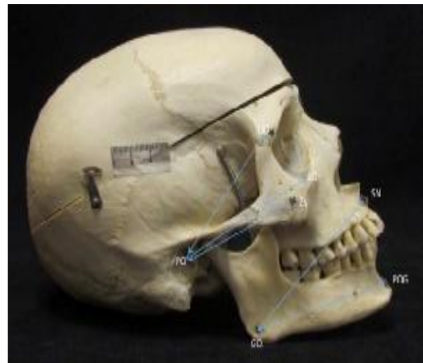
تصویر 3- نقاط سفالومتریکی برای اندازه‌گیری فاصله پوریون تا زایگون و طول تنه مندیبل