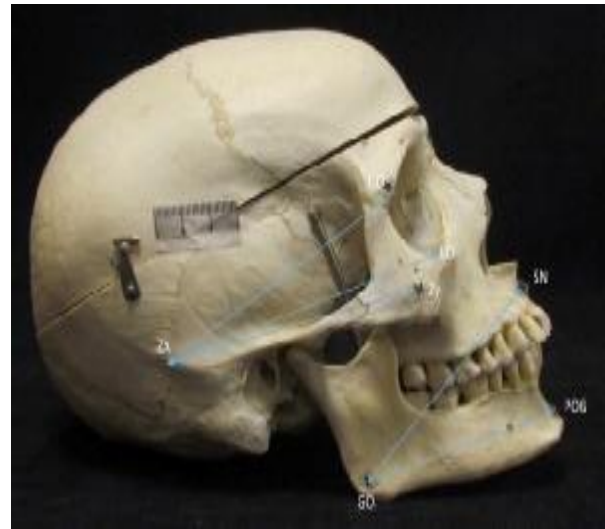
تصویر 2- نقاط سفالومتریکی برای اندازه‌گیری طول زاگوماتیک - تمپورال

گرچه در بررسی متون، تعدادی مقاله در مورد اندازه‌گیری جمجمه وجود دارد، اما نمی‌توان مطالعات مشابهی در زمینه مقایسه نیمه چپ و راست جمجمه یافت. ما عکاسی و اندازه‌گیری سه بعدی دقیقی بر روی جمجمه در 16 فاصله مختلف انجام دادیم (تصاویر 1 تا 3 و جدول 1).