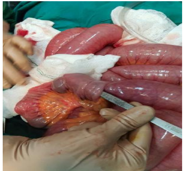
تصویر 3 - نشان دهنده انواژیناسیون

انواژیناسیون حالتی است که در آن بخشی از روده کوچک به داخل قسمت دیستال آن می‌لغزد. در مرحله بعد روده‌های در هم فرو رفته دچار تورم شده و منجر به انسداد روده می‌گردد. متعاقباً برای رفع انسداد، روده‌ها دچار انقباض می‌شوند. اگر چه در چند ساعت اول مدفوع ظاهری طبیعی دارد، اما به تدریج بعلت تورم جدار روده و فشار در آن ناحیه مخاط دچار خونریزی شده و مخلوط خون و مخاط بصورت ژله قرمز رنگی (Redcurrantjely) دفع می‌شود. دلیل پیدایش انواژیناسیون معلوم نیست و می‌تواند در هر سنی رخ دهد، اما اغلب اوقات در پسران زیر 12 ماه که قبلاً از سلامت خوبی نیز برخوردار بوده‌اند، دیده می‌شود. 2