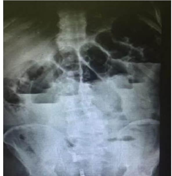
تصویر 2 - عکس ایستاده نشان دهنده سطوح متعدد مایع هوا