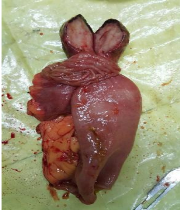
تصویر 4 - نمونه برداشته شده حاوی تومور