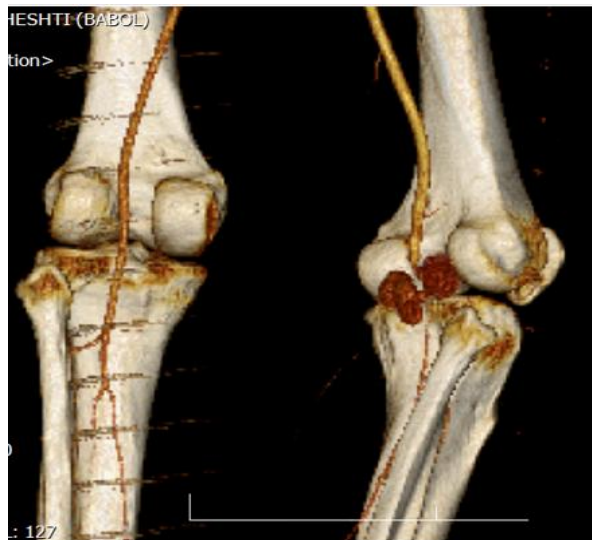
تصویر 1- بازسازی عروق و سودوآنوريسم مشخص شده

پس از پایان عمل بیمار به بخش منتقل شده و تحت مانیتورینگ مداوم پالس اکسی متری دیستال اندام و معاینات مکرر پالس و حس و حرکت قرار گرفت. دوره پس از عمل بدون مشکل طی گردید و در نهایت پس از ترمیم انسزیون‌های محل فاشیوتومی بیمار از سرویس جراحی عروق ترخیص گردید.