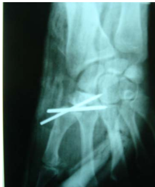
تصویر ۳ - بی حرکت ساختن به روش میله گذاری زیرجلدی (PCP)

Foucher دو روش جراحی را پیشنهاد می‌کند که یکی میله‌گذاری دوتایی و تحت کشش قراردادن مایل است و روش دیگر جاناندازی کامل مفصل است. ۱۵ همچنین Eaton و همکارانش بازسازی رباط را در موارد ناپایداری مزمن پیشنهاد