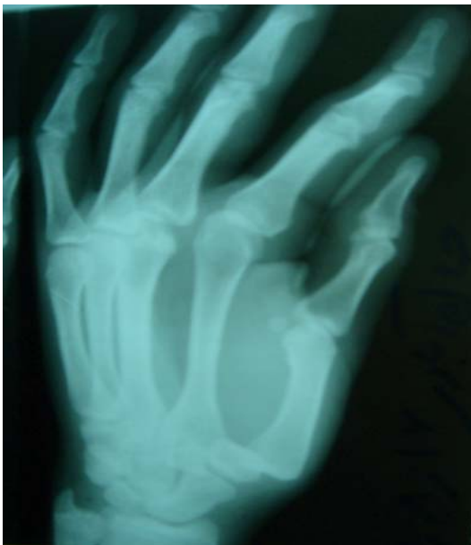
تصویر ۱- گرافی ساده قدامی- خلفی (AP) از دست بیمار که نشان دهنده دررفتگی پستی I- CMC بود