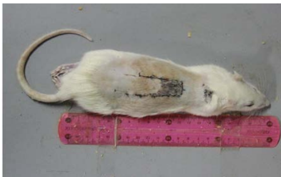
تصویر ۳- پس از ده روز همراه با نکروز