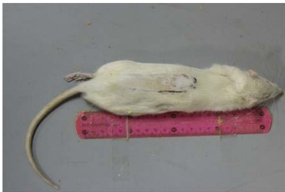
تصویر ۲- پس از ده روز بدون نکروز