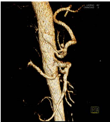
تصویر ۲ الف - تصویر بازسازی سه بعدی عروق احشائی بعد از عمل

با تشخیص قبل از عمل هماتوم داخل صفاقی تحت عمل جراحی قرار گرفت. قبل از عمل، بیهوشی با سوپنتانیل ۵۰ میکروگرم شروع شد و در موقعیت سوپاین با انسیزیون میدلاین وارد شکم شدیم که حدود ۲/۵ لیتر خون و هماتوم خارج شد. هر ۴ کوآدرانت را یک کردیم و سپس پک‌ها را خارج کردیم. پارانشیم کبد سالم بوده و ضایعه‌ای وجود نداشت. طحال سالم بود و در فضای خلف صفاق، هماتوم نبود. بعد از اکسیلوراسیون کامل متوجه شریانی در بین لوب کودیت و لوب چپ کبد شدیم که آنوریسمال و پاره شده بود. روی محل پارگی، لخته وجود داشت. با زدن بولداگ در قسمت پروگزیمال هیچگونه تغییر رنگی در لوب چپ کبد دیده نشد و تصمیم به لیگاتور قسمت دیستال و پروگزیمال کردیم. داروهای بیهوشی به کار رفته شامل ۱۴ میلی‌گرم اتومیدیت و ۲۰ میلی‌گرم سیس‌آتراکوریوم با N 2 O و ایزوفلوران بود. مدت کل بیهوشی ۲ ساعت بود و حین جراحی، ۱ واحد FFP، ۲ سالین هایپرتون و ۱۰۰ میلی‌گرم کلسیم گلوکونات و آمپول هیدروکورتیزون ۱۰۰ و ۲ میلی‌گرم میدازولام و ۳ میلی‌گرم فنتانیل برای بیمار استفاده شد (بیمار تحت بیهوشی عمومی قرار گرفت). در پایان شکم را شستشو دادیم و خشک کردیم و خونریزی نداشتیم، رنگ کبد هم نرمال بود و بعد شمارش وسایل، فاشیا را بستیم و پوست با نخ نایلون ۰-۳ دوخته شد (تصویر ۲). نهایتاً بیمار با تشخیص آنوریسم پاره شده شاخه چپ شریان کبدی خاص (Proper Hepatic)، تحت لیگاتور هر دو بخش پروگزیمال و دیستال آنوریسم قرار گرفت.