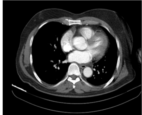
تصویر ۲ ب - مقطع سی‌تی اسکن عروق احشایی بعد از عمل

در بررسی‌هایی که در Med Line 2012 انجام گرفت، تاکنون هیچ مورد آنوریسم شریان کبدی پاره شده مشاهده نشده است.